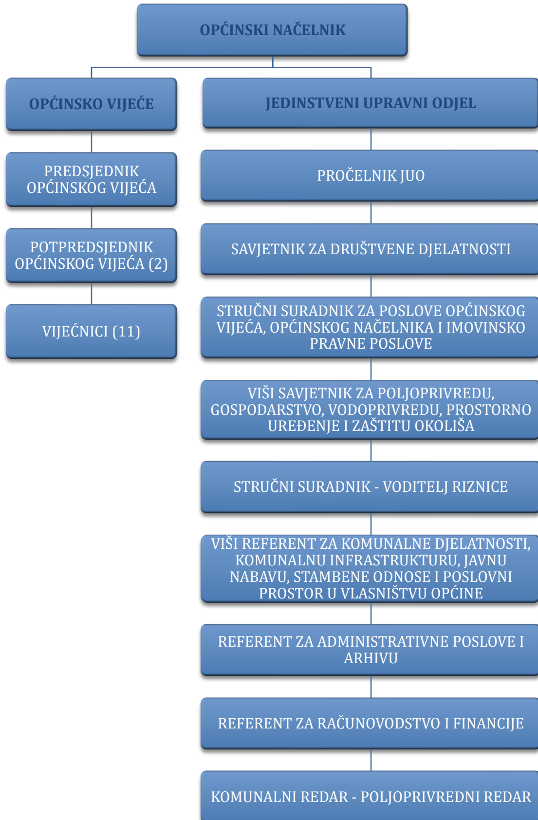
Slika 1. Organizacijska struktura Općine Sunja